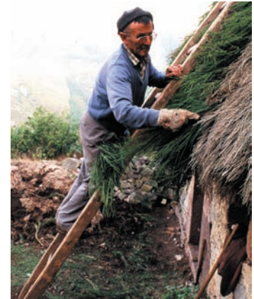
Lagning av halmtak, Asturien, Spanien