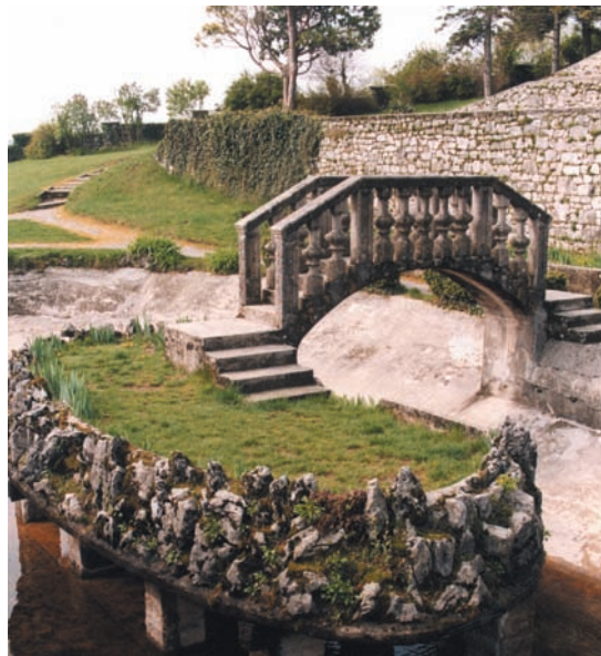
Park i Slovenien