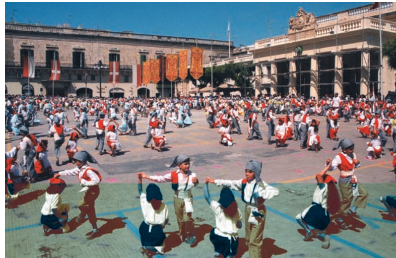
Dansande barn, Malta

muntlig tradition, umgängesseder och personer i besittning av särskilda kunskaper, etc. > Alla, från de rikaste till de fattigaste, har en kreativ kapacitet som kan tas till vara.