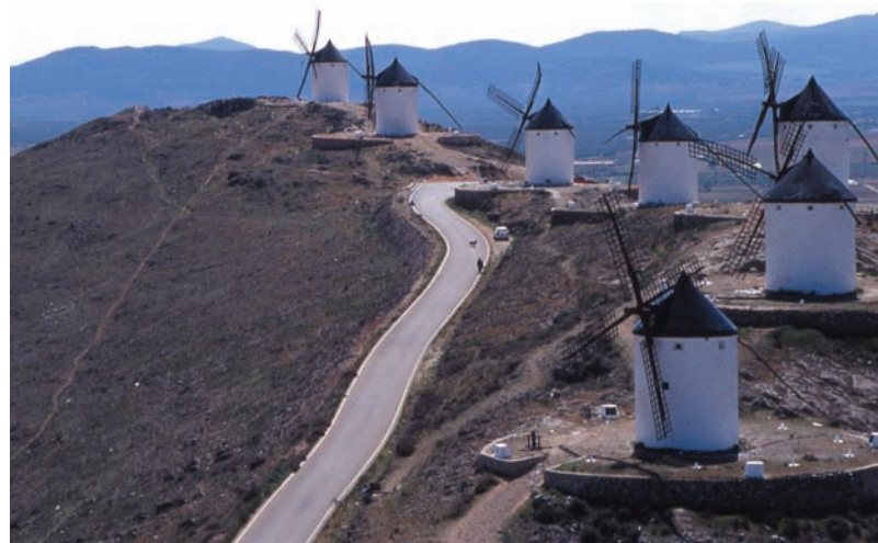
Väderkvarnar i Consuegra, La Mancha, Spanien

”En politik för det kulturella landsbygdsarvet” Rapport till det franska kulturdepartementet, 1994.