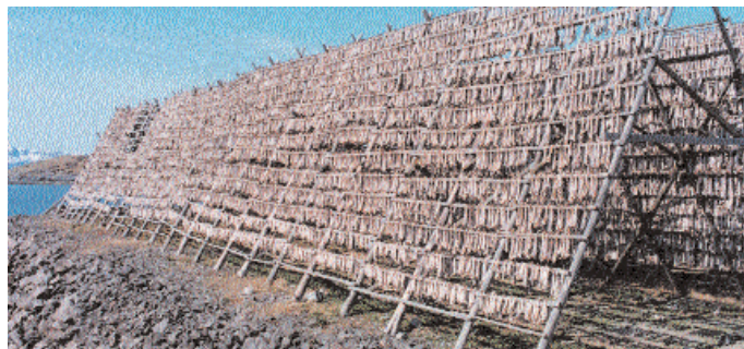
Torkning av torsk, Lofoten, Norge