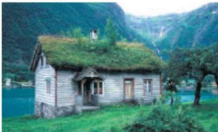
Gammelt hus, Dalsfjord, Norge

Genom att insamla människors hågkomster och använda kronologiska observationsmetoder, kan historieforskningen hjälpa oss att spåra förändringar i användningssätt, tekniker och "know-how", "savoir-faire", etc.