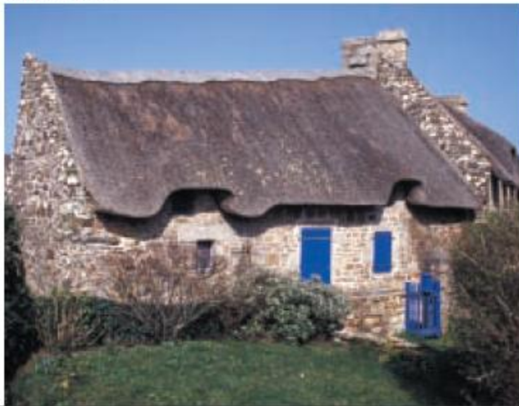
Hus i Finistère, Frankrike