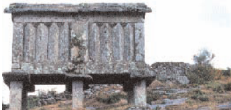
Förvaring av spannmål, Galicien, Spanien