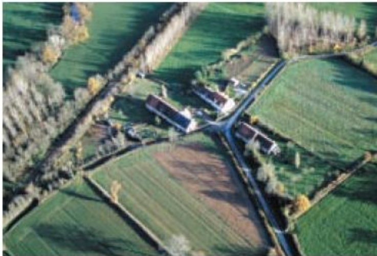
Landskap med skogsdungar, Berry, Frankrike